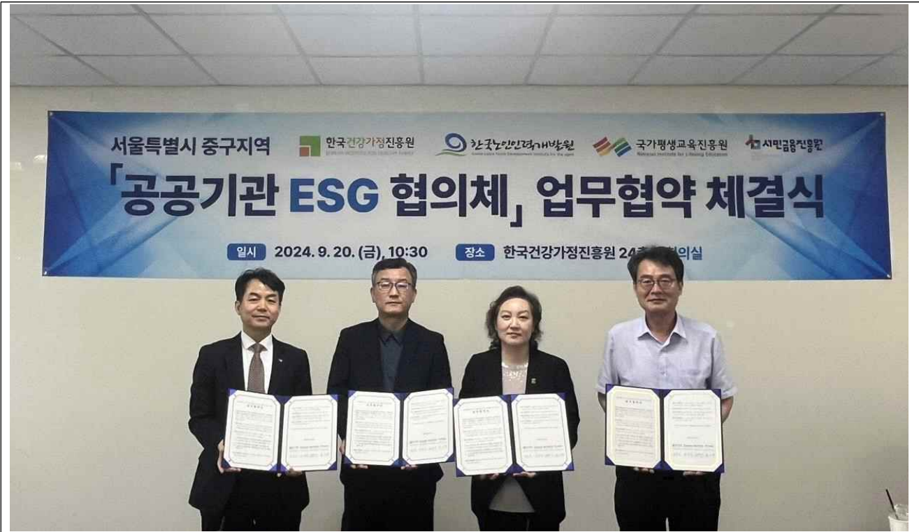
▲ 공공기관 ESG 협의체 협약식