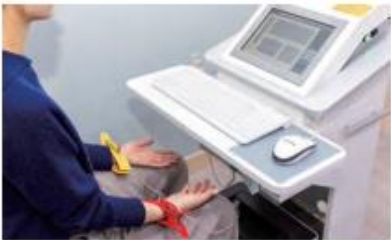
자율신경계 검사를 통해 스트레스를 측정하는 모습.

전반 두 개 이상 문항에 해당되면 '주의', 세 개 이상에 해당되면 '심각' 수준으로 일상생활에 어려움을 느낀다면 반드시 전문가의 도움을 받아야 한다.