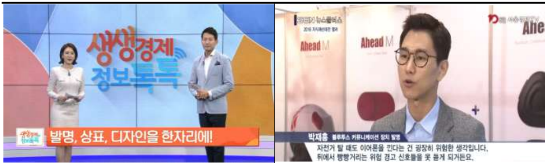
주요 매체 홍보 및 수상자 인터뷰(예시)