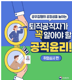
퇴직공직자가 꼭 알아야 할 공직윤리

지난 12월 청렴·윤리경영 브리프스 주제는 '기업과 인권경영'이었습니다. 인권경영의 실천 방법에 대해 함께 고민하고, 우리 사회 전반에 인권경영이 퍼져나가는 계기를 만들기를 바랍니다.